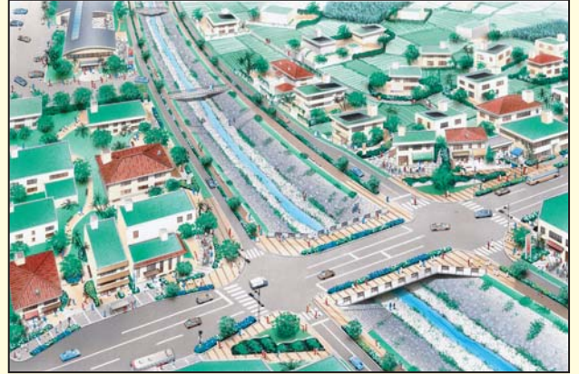
▼小波津川橋周辺の整備イメージ図