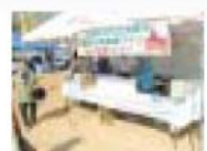
豊原町特産物ワイン販売コーナー