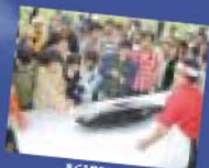
まぐろ解凍ショー