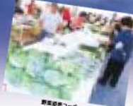
野菜研究コーナー