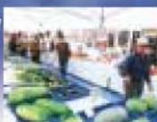
農産物産産コーナー