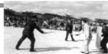
踊りかきつたお祭りや子どもたちも楽しめる催し。写真左側は踊り隊