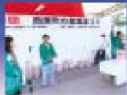
西原町産品引合展示会