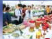
農産加工品コーナー