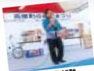
町民の力をあかしめ展示会