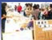
町大協会のバインの産産コーナー