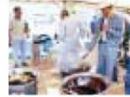
シージュースープ（農産物）