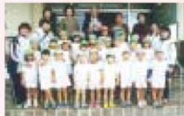
西原百百合保育園の職員たち