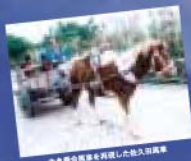
西原町乗馬会を代表した色入田乗馬

これまでは農産物を中心に農産展示会として開催してきましたが、今年度は町商工会も加わって、大規模な産業まつりになりました。