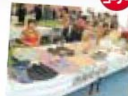
西原町婦人連合会