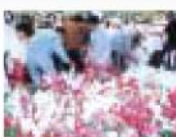
島木の製材配付（ブーゲンビリア）