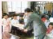
入城幼稚園にプレゼントを手渡す職員たち