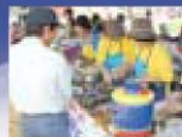
生活研究会産産コーナー