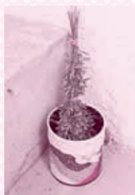
水を入れた容器につけておきます。