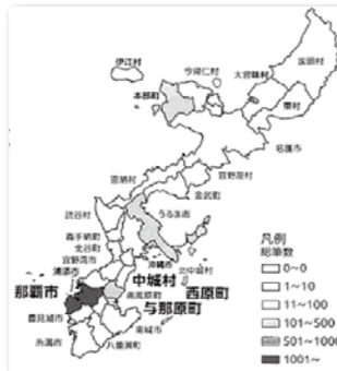
所在市町村別の所有者不明土地の分布図