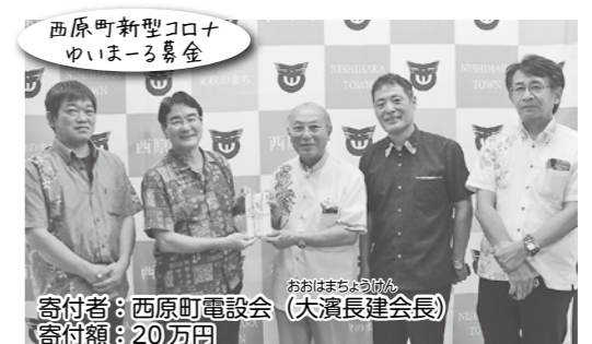
西原町新型コロナゆいまー募金 寄付者: 西原町電設会 (大濱長建会長) 寄付額: 20万円