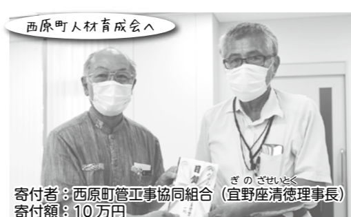
西原町人材育成会へ 寄付者: 西原町管工事協同組合 (宜野座清徳理事長) 寄付額: 10万円