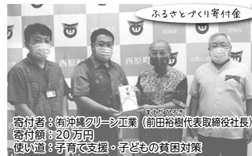
ふるさと桐くり寄付金 寄付者: (有)沖縄クレーン工業 (前田裕樹代表取締役社長) 寄付額: 20万円 使い道: 子育て支援・子どもの貧困対策

申込先 西原町雇用サポートセンター(産業観光課内) お問い合わせ ☎098-945-4540