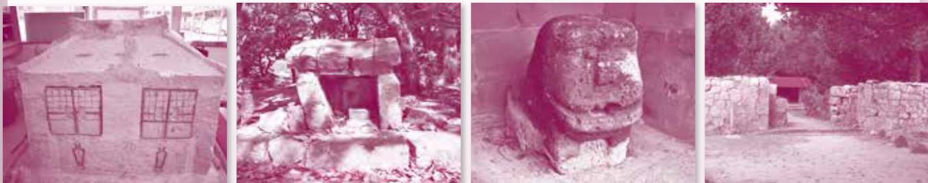
写真⑦ 石厨子 写真⑤ ウフンミウタキの祠 写真③ 呉屋の石獅子 写真① 内間御殿