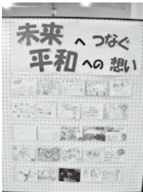
絵ハガキに描いた平和への思い