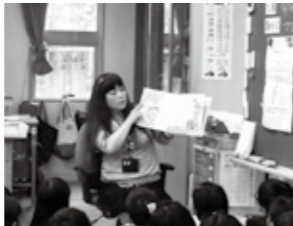
読み聞かせのようす(坂田小学校)