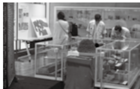
戦争遺品を見るようす