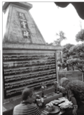
小波津戦没者慰霊碑