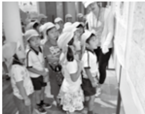
見学のようす(西原東幼稚園)