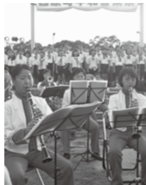
西原町小中高合同吹奏楽団