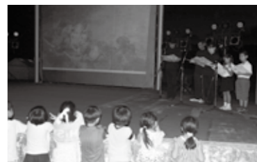
紙芝居に聞き入る子どもたち