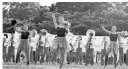
西原高校マーチングバンド部