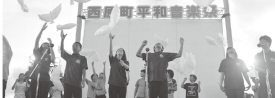
鳩型の風船を空に放ちます

音楽をとおり、平和のメッセージを発信し、平和について思いを巡らす機会となりました。