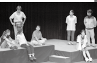
平和とは何かを考える子どもたち