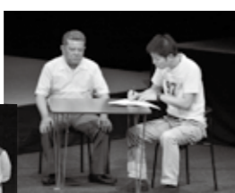
戦争体験者の代わりに戦争体験を書く