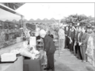
小橋川戦没者刻銘碑