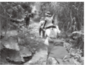
平和への思いを胸に、登ります