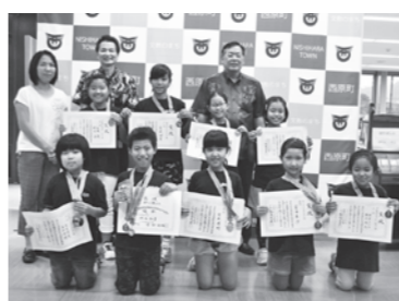
西原なぎなたクラブのみなさま