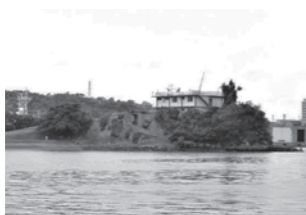
那覇軍港内に浮かぶ御物城

一本の電話を機に「なぜ、なに、どうして」を連発する幼児の質問期のように「知らないことを知りたい」という気持ち、今でもあるかしら? と自問する日々を過ごしています。