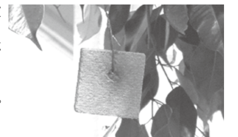
誘殺板(テックス板) ※口にいれなければ害はありません。

お問い合わせ 沖縄県病害虫防除技術センター ☎886-3880 建設部産業課 農林水産係 ☎945-4540