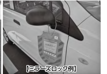
【ミラーズロック例】

※納税相談も行っています。滞納処分を受けることのないようにお早目にご相談ください。