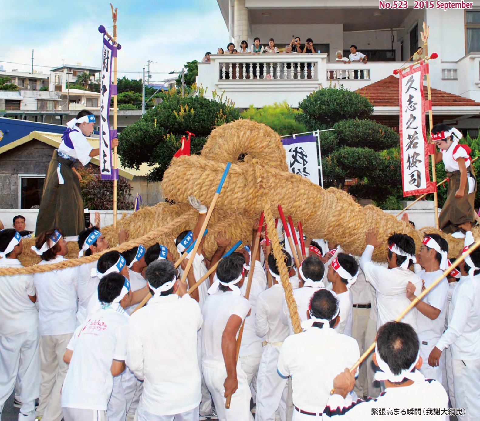
緊張高まる瞬間(我謝大綱曳)