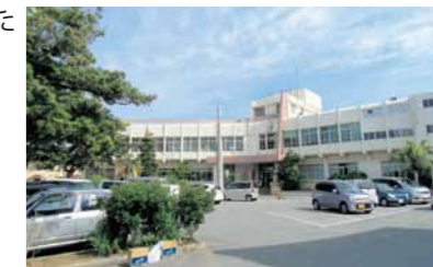
▲西原町役場旧庁舎(本庁舎)