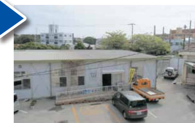
▲福祉部のあった第5庁舎