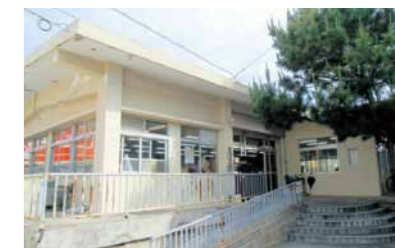
▲西原町教育委員会庁舎