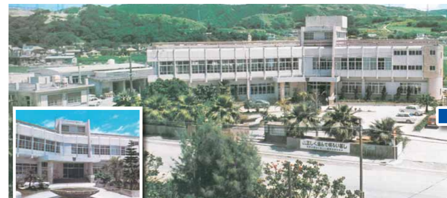
▲昭和49年ごろの村役場庁舎

平成26年2月、西原町役場の新庁舎が新しく建てられ、5月に移転が完了。旧庁舎となった字嘉手苅の庁舎は、46年の長い歴史を終えました。