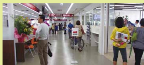
町役場1階を見学する来場者

4月26日と27日の2日間の日程で、西原町役場新庁舎の見学会が行われ、一般公開されました。見学会には2日で延べ約2,100名が来場。できたばかりの役場や議会の議場、さわふじ未来ホールなどを見学しました。