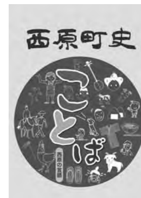
西原町史第8巻「西原の言語」

また、エントランスホールでは『しまくとぅば普及ソング2013』(DVD)の上映を行います。世代を超えて受け継がれ、地域に根ざした「しまくとぅば」。しかし、使う人も、聞ける人も少なくなったのも事実です。この機会に「わたったーくとぅば」に触れ、見直してみませんか?