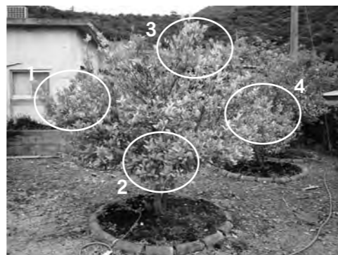
東西南北より4枝採取

4方向から症状のある葉を含む枝を1本ずつ採取し、袋に入れる。 ※持ち込みは、西原町役場や下記の専門機関にお問い合わせください。