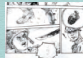
執筆中の原画より