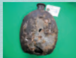
幸地から出土した「水筒」