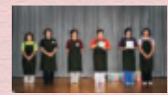
読みあいネットワーク喜楽星7