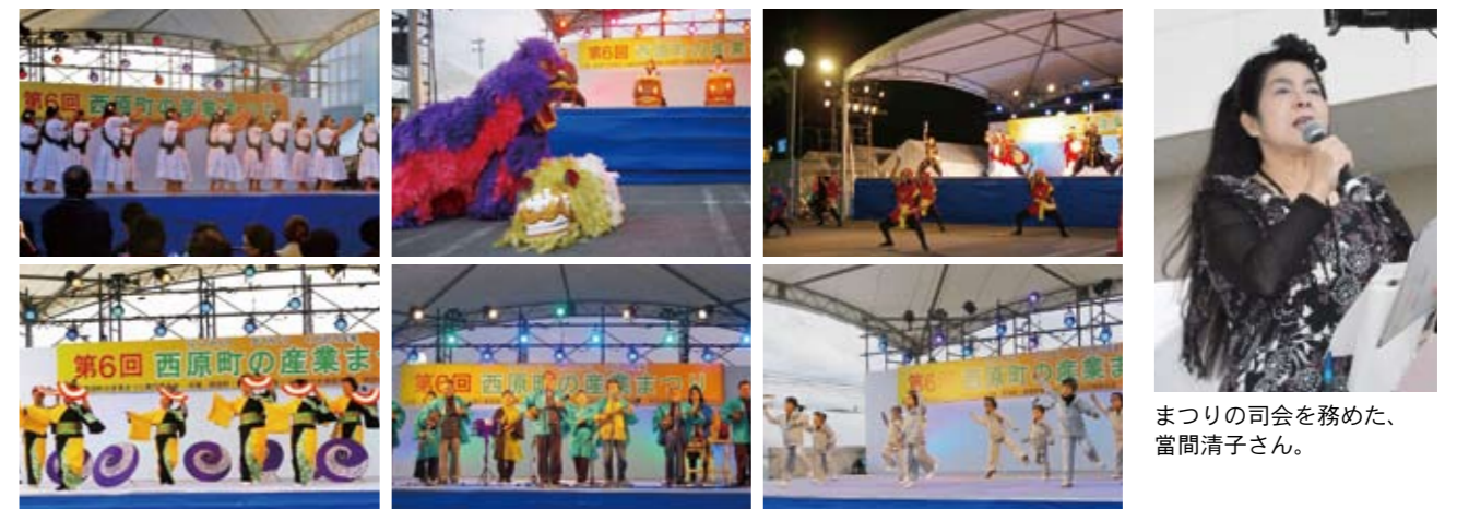
ステージでも数々のイベントが行われました。