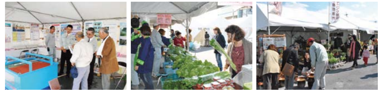
たくさんの西原町産品が並んだテナント。大勢の人が町産品を買って求めています。