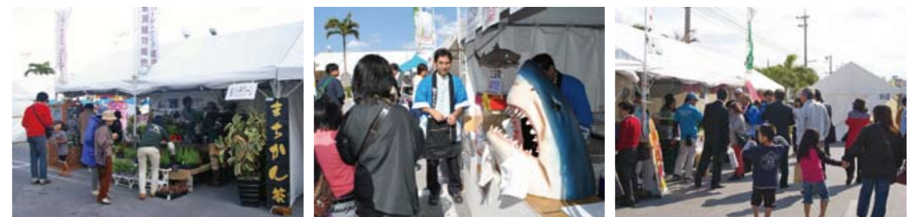
2日間とも好天に恵まれ、多くの町民などがまつりに訪れました。