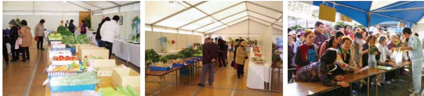
出品展示会の会場には、数多くのすばらしい作品が並びました。