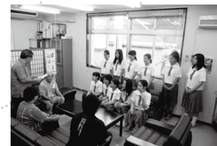
西原中学校(合唱)への交付式【8月29日】