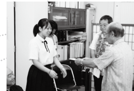
西原高校(男女バレーボール・女子バスケットボール)への交付式【7月23日】