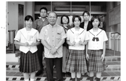
西原東中学校(なぎなた) 浦西中学校(沖縄選抜演劇団)への交付式【7月19日】