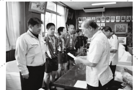
西原クラブ(バレーボール)への交付式【8月7日】