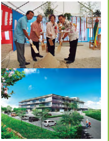
▲ 南東側からのイメージ

庁舎等複合施設の建設工事のようすを、ブログを通じて発信していきます。完成に向けて日々進んでいく工事のようすをブログでチェックしてください。