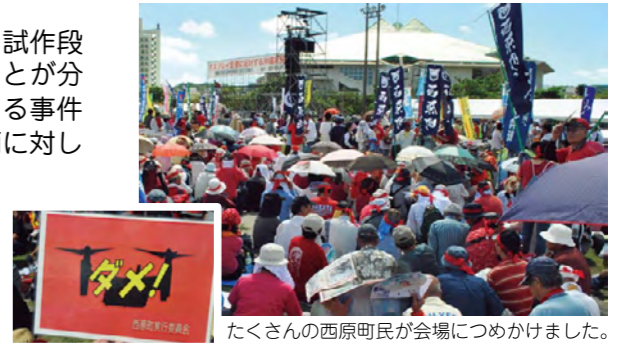
たくさんの西原町民が会場につめかけました。