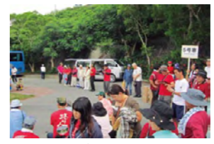
多くの町民が町運動公園に集まり、西原町職員労働組合が、給水所を担任しました。