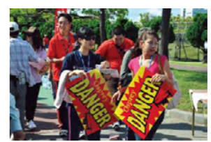
親子連れも若者も、たくさんの方が会場に足を運び、オスプレイ配備の阻止を訴えました。