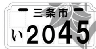
【新潟県三条市】 市の花:ヒメサユリ