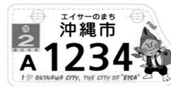
【沖縄県西原町】 「エイサーのまち」の「エイ坊」