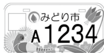
【群馬県みどり市】 市の鳥木花:キジ・サクラ・カタクリ