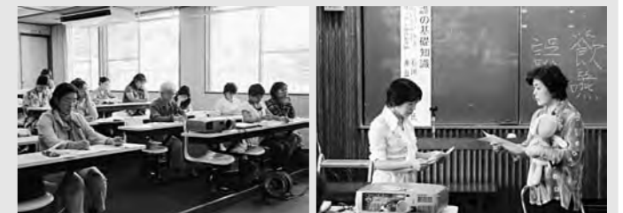
真剣な表情の受講者

3町村広域のファミリーサポートセンターは10月に準備室がスタートし、サポーター1期生も徐々に活動しています。平成24年4月の開所に向けてひとりでも多くのサポーターが活躍できるように準備を進め、「地域で見守る子育て」の実現を目指していきます。