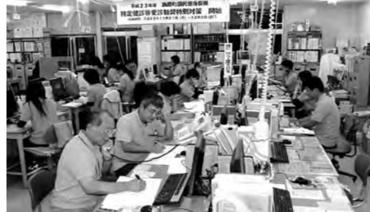
上間町長らが電話で一斉に受診勧奨を実施

期間中、町では電話や戸別訪問、広報車による広報などを実施して、町民に受診勧奨を呼びかけ、受診率の向上を目指しました。