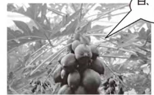
台農5号ではありません。