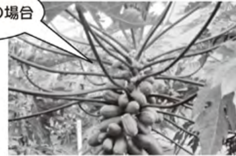
「台農5号」の可能性があります。