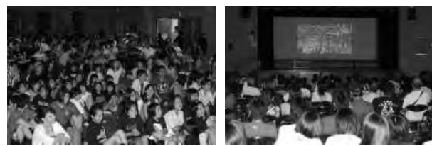
(一喜一憂する観衆)

7/29(木)～8/3(火)西原町中央公民館大ホールにて、美ら島総体2010(女子バスケット)のパブリック・ビューイングを実施しました。県代表や決勝戦の試合は、立見が出るほどの大入満員。町民のバスケ熱の高さが垣間見えました。