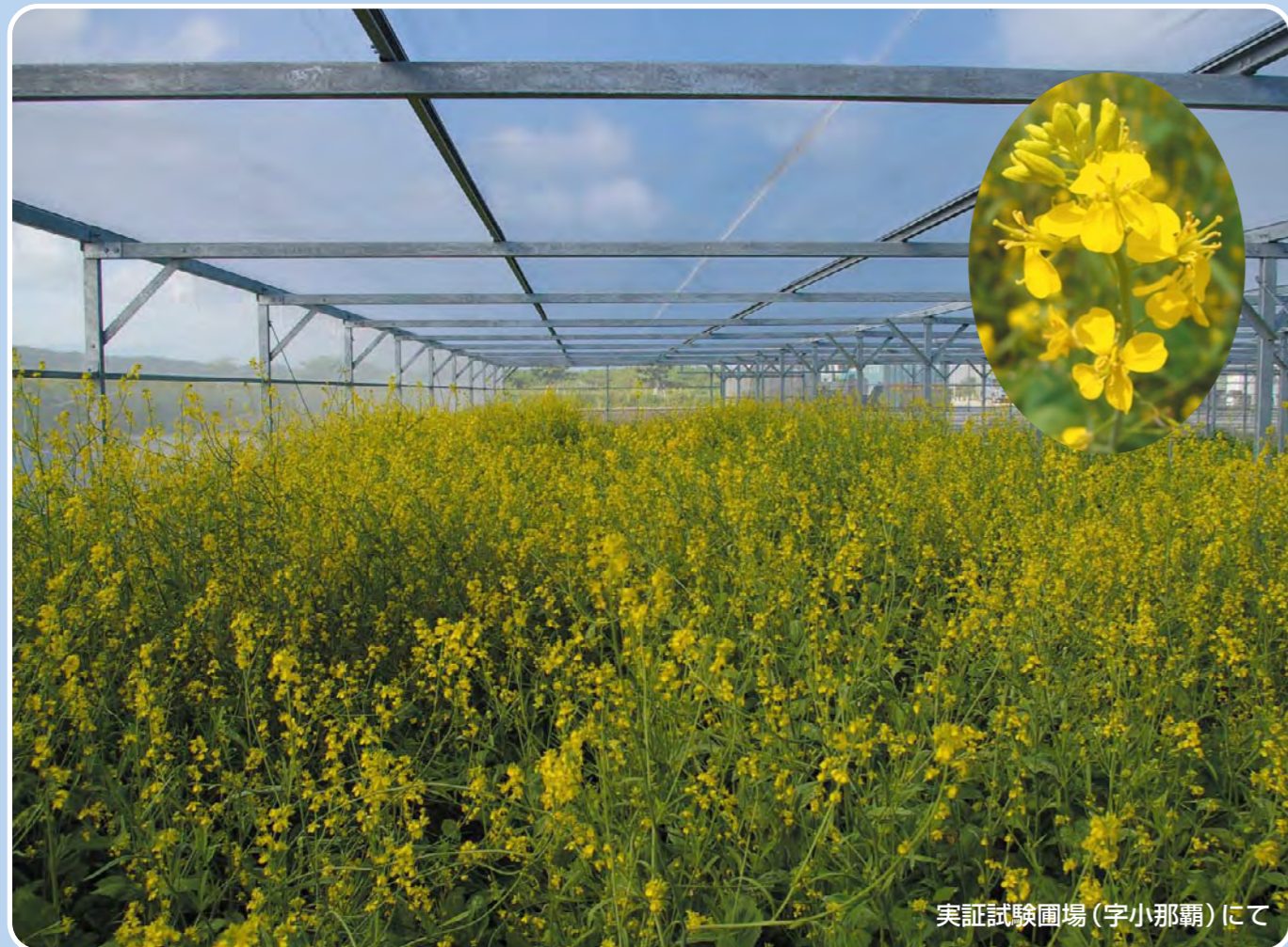
実証試験圃場(字小那覇)にて