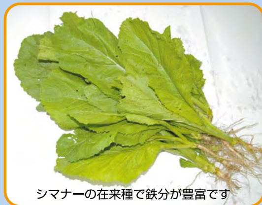
シマナーの在来種で鉄分が豊富です