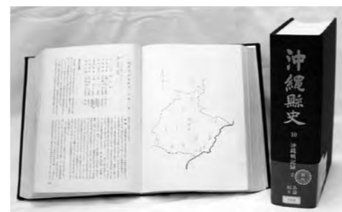
戦争体験が掲載されている『沖縄県史』

そしてこの度、テープ八十八本、一五〇時間にも及ぶ貴重な録音テープが、沖縄県公文書館において発見、修復されました。テープには、西原村出身者五十七名の肉声が録音されています。町立図書館では平和教育、平和行政の推進に活用しようとして、テープの一般公開に向けて、当時の証言者、またはその親族の方々から承諾書をいただいています。町立図書館の職員がご承諾をいただきに伺う際には、ご協力をお願いいたします。