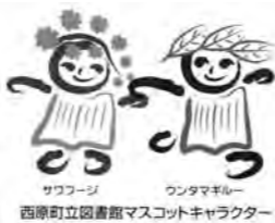
サワフジ ワンタマキル 西原町立図書館マスコットキャラクター