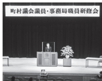
▲ 町村議会議員・事務局職員研修会の様子

テーマは「令和4年度市町村予算と行財政運営の課題について」、「町村議会の現状と課題及び選挙公営について」、「新型コロナウイルスの流行状況と感染対策について」で、本町からは議員14名と職員2名が参加し、資質向上に努めました。