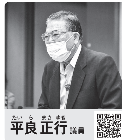
平良 正行 議員

この一般質問の内容は、会議録（反訳文）に基づいて各議員が質問の一部をまとめ、本委員会が最終確認・編集をしたものです。 各議員氏名横のQRコードからその議員の一般質問の動画がご覧いただけます。