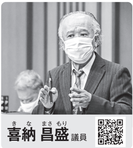
喜納 昌盛 議員

●この一般質問の内容は、会議録(反訳文)に基づいて各議員が質問の一部をまとめ、本委員会が最終確認・編集をしたものです。 ●各議員氏名横のQRコードからその議員の一般質問の動画がご覧いただけます。