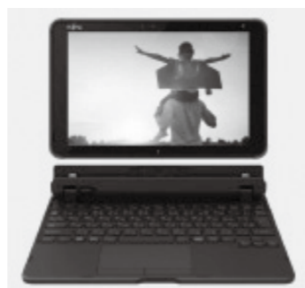
子どもたちに配布される PC 端末

1人に1台の端末が整備されることで、子どもたちの学びは一層充実していきます。これまでの授業のあり方が変わり、端末を活用した双方向の授業によって、一人一人の反応を踏まえたきめ細かな指導や学習状況に応じた個別学習が可能になり、多様な子どもたちに個別最適化された学びが提供できるようになります。また、端末を適切に活用して、情報を収集し、まとめて、発信する活動や、それらを協働的に行うことを通して、情報活用能力を含む「確かな学力」の向上が期待できます。